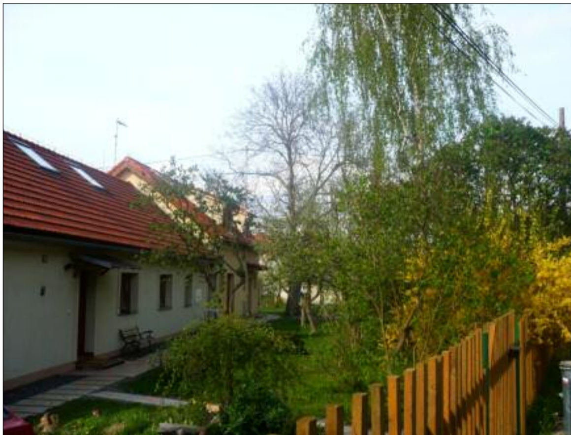
Dětský domov Husita v Dubenci u Dobříše funguje už pět let