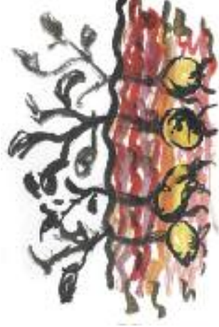
Ilustrace: Lucie Kráčířiková

Při sázení bramborů bývalo také práce dost a dost. Nejdříve se musily ze sklepa pod stodolou vynosit na mlat, přebírat všechny, malé a poškozované vykrájet pro dobytek, prostřední dát zvlášť na sázení a zbytek k jídlu nebo pro dobytek. Při sázení jsem obvykle zase poháněl vola, sestra Anči jako starší už musila brambory pod brázdu rozkládat (sázet). Ale jen se brambory ukázaly venku, tj. měly první listy, hned se musily uvláčet