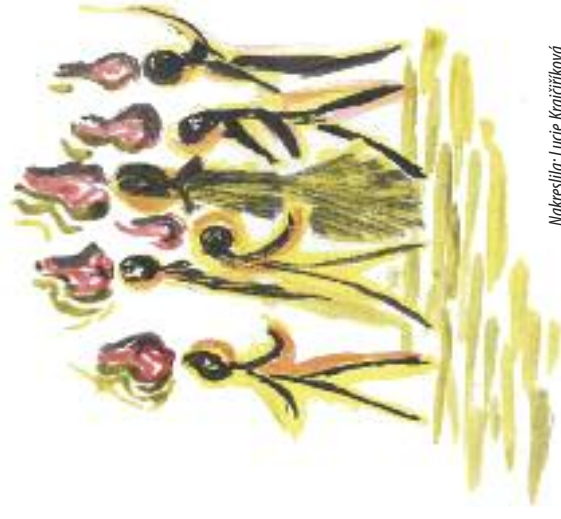
Nakreslila: Lucie Krajčůrková

Událost je v Bibli popsána takto: Když nastal den letnic, byli všichni učedníci shromážděni na jednom místě. Náhle se strhl hukot z nebe, jako když se žene prudký víchr, a naplnil celý dům, kde byli. A ukázaly se jim jakoby ohnivě jazyky, rozdělily se na každém z nich spočinul jeden. Všichni začali ve vytržení mluvit jiným jazykem, než byl jejich vlastní, i když se je nikdy neučili. Lidé, kteří je slyšeli, žasli, protože i když mezi nimi bylo mnoho cizinců, každý jim rozuměl. Někteří si mysleli, že jsou