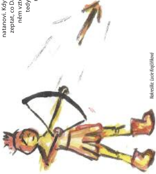
Nakreslila: Lucie Krajčůrková

Když David nepřišel ke králově hostině ani první ani druhý den, stalo se přesně to, čeho se obával – Saul se rozzuřil a svůj hněv obrátil i vůči Jónatanovi. Když se ho jeho syn odvažil zeptat, co David provedl, hodil po něm vztekly kral kopí. Jónatan tedy vyšel na smluvené místo a vystřelenými šípy dal Davidovi znamení, že musí uprchnout. Když poslal svého služebníka se šípy a zbrojí domů, vyšel David ze svého úkrytu, aby se s přítelem naposledy objal a rozloučil. Od této chvíle byl David psancem. JK