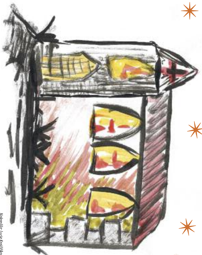
Nakreslila: Lucie Krajčičková

dopředu ke stolu Páně, v němž byl uzamčen krásný zlatý bohoslužebný kalich. Jeho úmysly nepochybně nebyly čestné. Dřímající kostel si nejprve ničeho nevěštil. Z lehkého spánku jej však náhle