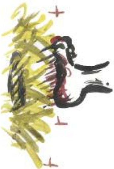
Nakrestlice: Lucie Kratočvíková

Snad si vzpomenete na to, že před časem bylo v Cestě uveřejněno vyprávění o strýci Mikuličkovi, který nám, dětem, žijícím před lety na malé vesnici, sděloval užasně věci, například to, že kdysi dávno byli Češi velkým národem obyvajícím spousta zemí na světě. Dokládal to příklady, které nás přesvědčovaly, že má pravdu. Tentokrát vás chci seznámit s dalšími překvapujícími objevy strýce Mikuličky. Týkaly se názvů řady našich měst, které