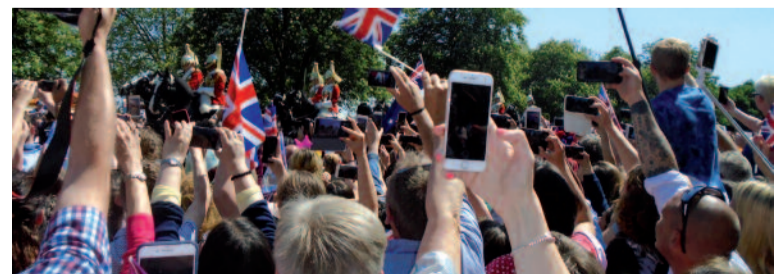
Tam někde je Harry s Meghan v kočáře landau