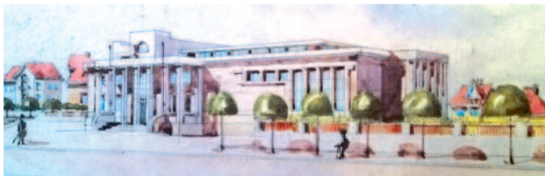
Návrh Husova sboru v Jaroměři

V doprovodném programu vystoupí pěvecký sbor Cantus Jaroměř a smíšený sbor Smetana z Hradce Králové.