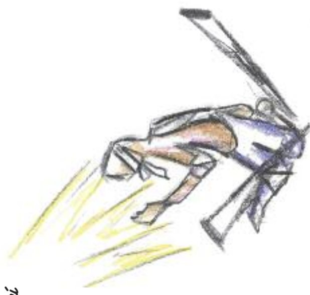
Nakreslila: Lucie Krajčířková

Ježíš však nebyl jediný, kdo měl od Pána Boha schopnost uzdravovat nemocné. Za všechny si připomeňme například proroka Elišu, který vyléčil Aramejce Naamána z malomocenství, aniž od něj přijal jakoukoliv odměnu. Jeho učedník Géchazi se z nabízené