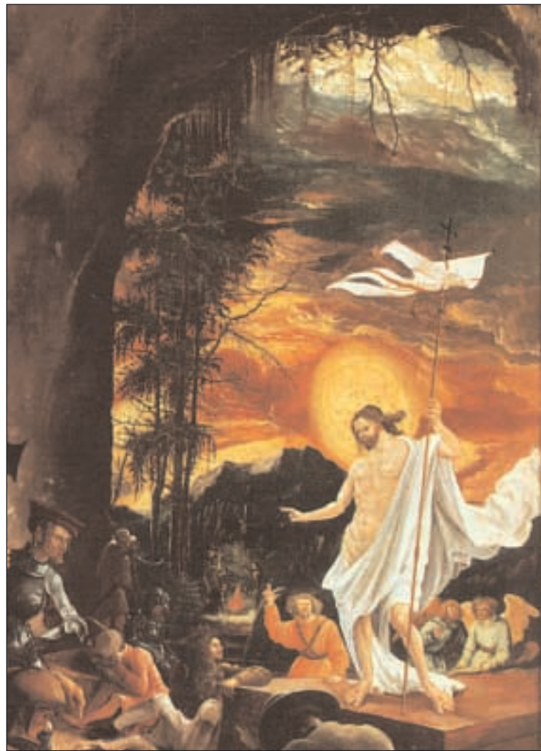
Albrecht Altdorfer (1480-1538): Vzkříšení, 1518

schopný potlačiť prípadné povstanie, a preto som sa rozhodol podniknúť opatrenia, ktoré by zaručovali v meste klud, aby mi Pretorium nevytklo slabosť alebo nedbalosť. Písomne som požiadal Ježiša o osobný rozhovor v Pretorii. V mojich žilách koluje španielska krv, zmiešaná s rímskou, a preto nie som náchylný pociťovať detské pohnutie alebo strach. Bol som vo svojej bazilike, keď prišiel Nazaretský. A vtedy boli odrazu moje nohy ako prikované na mramorovej dlážke. Triasol som sa na celom tele ako previnilý zločinec, zatiaľ čo on bol pokojný a pokorný, ako nevinnosť sama. Ježiš podišiel bližšie ku mne a so žiarivým výrazom povedal: „Tu som.“ Chvilu som s obdivom a s úctou pozoroval tento mimoriadny obraz muža neznámeho našim maliarom, ktorí dávajú formy a podoby postavám našich bohov a hrdinov. „Ježiš!“ konečne som povedal, pričom sa môj jazyk zajakával. „Dovolil som ti za posledné tri roky neobmedzenú slobodu prejavu a nelutujem toho. Tvoje slová sú slová múdreho muža. Nevieš, či si čítal Sokrata alebo Platóna, ale pokiaľ viem, v твоjich slovách tkvie majestátna prostota, ktorá ťa vysoko povznáša nad týchto filozofov. Cézar je o tom upovedomený, a ja, jeho nepatrný sluha, cítim sa na tejto zemi šťastný, že som ti mohol poskytnúť slobodu, ktorej si tak hodný. Nemožno sa čudovať, že pre tvoje učenie povstali proti tebe mocní a zarytí nepriatelia. To nikoho neprekvapuje, veď aj Sokrates mal svojich nepriateľov a padol za obeť ich nenávisťi. Tvoji nepriatelia sú na teba dvojná-