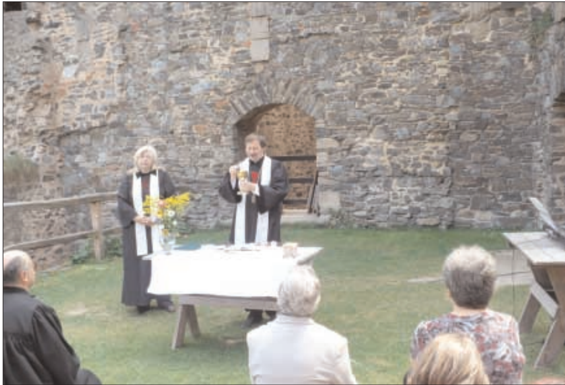
Setkání mládeže na Krakovci ve dnech 7. - 9. srpna bylo zakončeno bohoslužbou

liže v minulosti bylo migrantům vcelku otevřené, právě v zemích s největším podílem cizinců se nálady zvolna mění a ustupují nacionalismu a xenofobii. Velmi častým argumentem je, že cizinci neznají naši kulturu a přinášejí svoji vlastní, kterou by rádi jednou v nové zemi viděli jako vůdčí. Pravdou ovšem je, že podle statistik z roku 2004 bylo v Evropě evidováno ze všech migrantů jen 37 % z jiných než evropských zemí. Celých 63 % tedy tvoří Evropané, kteří se stěhují za lepší prací, za partnerem nebo jen z touhy po něčem novém, po dobrodružství. Bohužel je stále také dost evropských zemí, odkud lidé odcházejí ze strachu nebo kvůli nesvobodě. Důležitým faktorem migrace je také skutečnost, že v posledních letech přichází do Evropy hledat útěchu mnohem více žen, často s dětmi, než mužů. Bohužel, v mnoha případech proto, že jejich muži jsou již po smrti nebo v zajetí, nebo utíkají právě od nich. Od Evropanů jako vzoru svobody hledají pomoc, ale většinou nalézají mříže azylového tábora nebo odmítavé tváře kolemjdoucích. Úkolem církvi by tedy v této situaci mělo být poskytnutí prvotní pomoci, pokud státní síly nestačí, ale především dít pomáhat nově přichozím důstojně žít v nové zemi, aby se nemožily zástu-