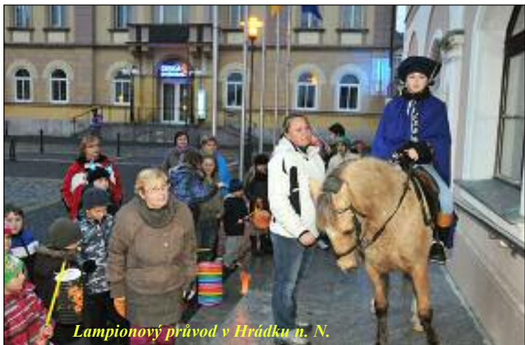
Lampionový průvod v Hrádku n. N.

Roční předplatné na rok 2013 činí 416 Kč. Číslo účtu: 43-3856220207/0100