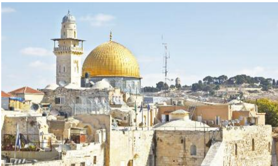
Pohled na dnešní Jeruzalém