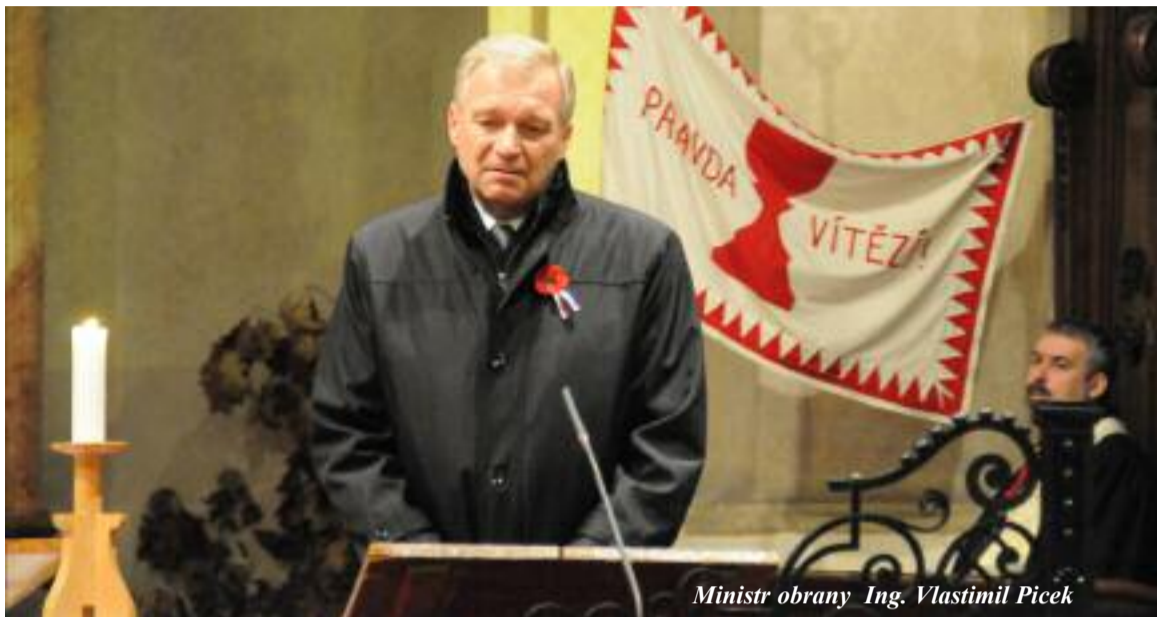
Ministr obrany Ing. Vlastimil Picek