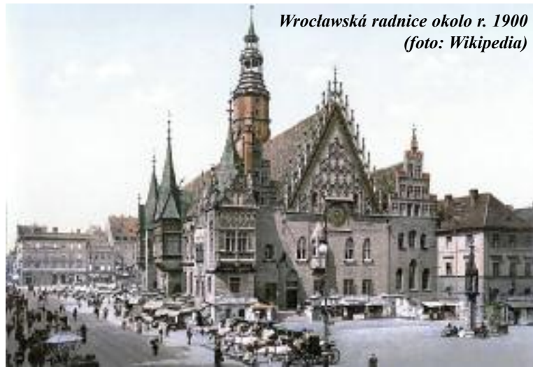
Wroclawska radnice okolo r. 1900