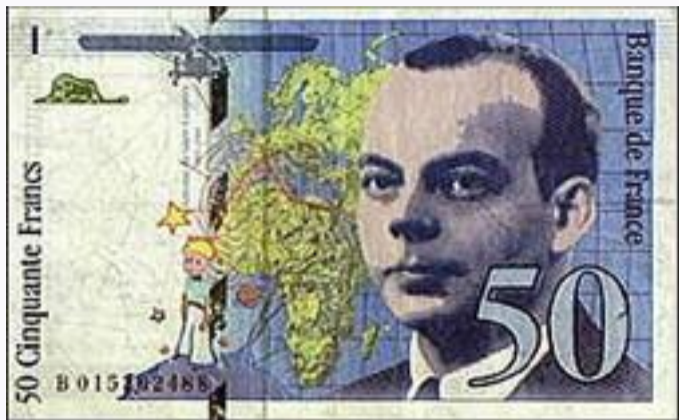
Antoine de Saint-Exupéry na francouzské bankovce

Co vlastně víme o člověku, který je od 31. července 1944 nezvěstný? Letec, voják, ale i spisovatel a myslitel. Ale také technik – jen v letech 1934 až 1940 předložil k patentování dvanáct návrhů z oboru radiogoniometrie a termodynamiky. Tato dvojakost, která je pro mnohé nevysvětlitelná, je tajemstvím jeho života. Každopádně pak osobnost, která po generace oslovuje bezpočet lidí jako nikdo jiný.