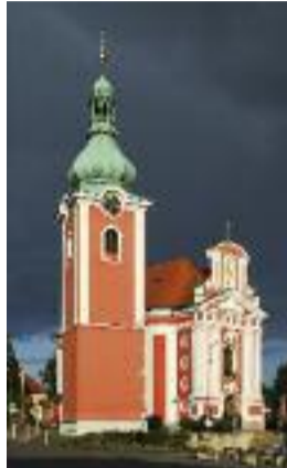
Červený Kostelec