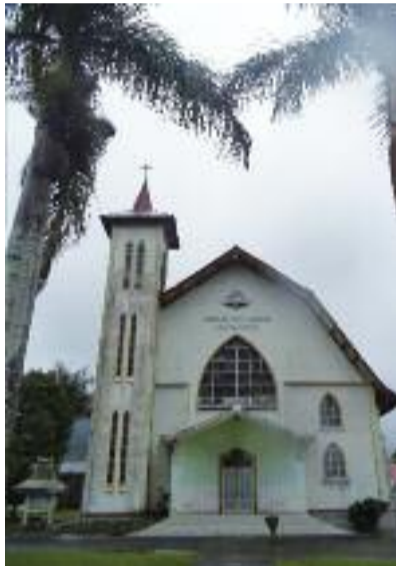
Kostel na ostrově Flores

to stavu vědomí, zaváněl herezí... Katolická církev také dost napomohla integraci Indonéské republiky. Indonésie je stát multietnický a multijazykový. Ale opravdu „multi“: Existují zde jazyky košaté s bohatou literaturou, jako třeba javánština, sundánština, balijština, ale v pralesích Papui či Bornea je mnoho kmenů, jejichž jazykem mluví třeba jen několik tisíc lidí. Celkově je těch jazyků mnoho set; jenom v provincii Papua je jich 270. Úředním jazykem Indonésie je indonéština, což je upravená malajština – dorozumivací jazyk přístavních obchodníků. Od dnešní malajštiny se však liší např. množstvím holandských slov (Indonésie byla holandskou kolonií, Malajsie nikoli). V českém vydání Hesel Jednoty bratrské je v úvodu psáno, do kterých jazyků jsou přeložena.