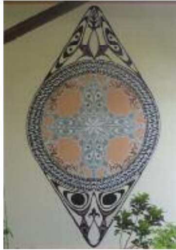
Papuánský kříž v tradičním stylu, namalovaný na zdi kláštera

starší. Nicméně křesťané na Bali jsou, a to i přesto, že být Balijskem de facto znamená být hinduistou. Sborny, které jsem viděl, jsou v neděli přeplněné tak, že můžeme Balijscům závidět. Zdejší kostely jsou většinou moderní stavby. Ale znám i jeden opravdu kuriózní, který je v hlavním městě. Je postaven trochu ve stylu balijských hinduistických chrámů: totiž z hnědooranžových cihel s vytesanými kamennými doplňky s dekorativními motivy