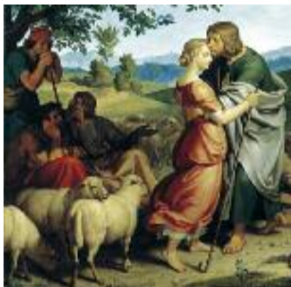
Josef Führich: Výřez z obrazu Josef a Rachel

Tím spíš, když se jednalo o umění s náboženskou tematikou. Nezáleželo přitom ani, jestli se dotýká umělci vůbec profilovali národnostně nebo politicky. Podobný osud potkal i dílo rodáka ze severočeské Chrastavy, malíře Josefa Führicha. Výběr z jeho obrazů bude až do 14. září vystaven v Oblastní galerii Liberec, v zrekonstruovaném objektu monumentální budovy bývalých Lázní císaře Františka Josefa I. Kresby mladého Führicha zaujaly frýdlantského hraběte Clam-Gallase a později knížete Metternicha. První ze šlechticů mu umožnil studium