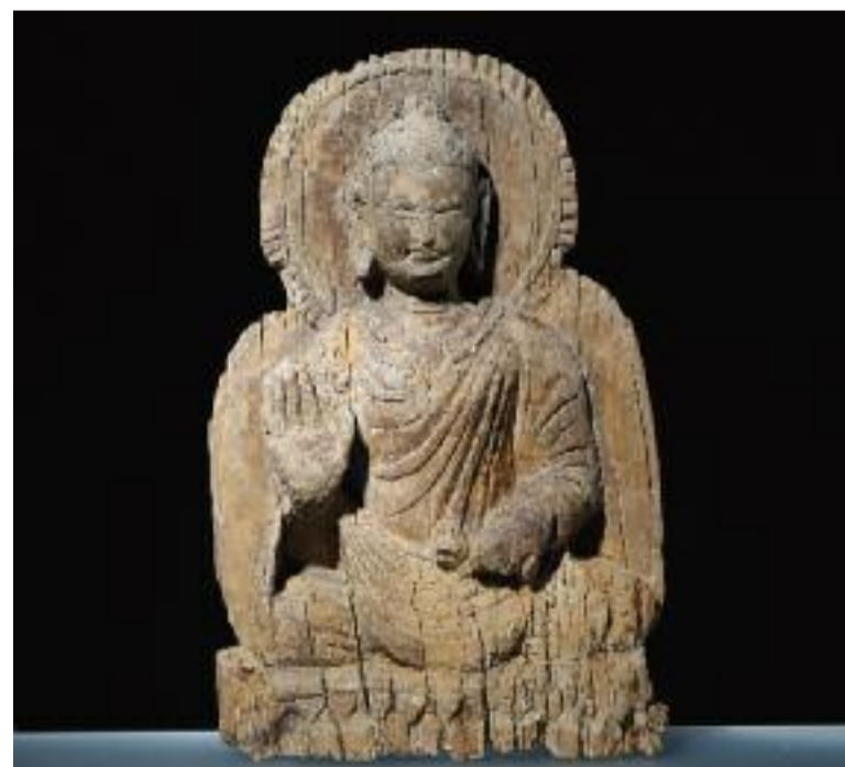
Dřevěná soška sedícího Buddhy z výstavy.

Až do 4. září můžete v Náprstkově muzeu (součást Národního muzea) zhlédnout výstavu Afghánistán – zachráněné poklady buddhismu. Prezentuje památky afghánského buddhismu z období 1. až 9. století po Kr., zachráněné před řáděním náboženských fanatiků. Mnohé z nich budou prezentovány vůbec poprvé mimo území Afghánistánu. I když se spojení buddhismu s územím Afghánistánu může zdát hodně překvapivé, jeho působení na formování staré afghánské kultury bylo obrovské. Výstava je rozdělena do několika částí. „Na začátku se návštěvníci seznámí s historií předislámského Afghánistánu a dozvědí se například, jak s touto oblastí souviselo tažení Alexandra Velikého, který se na území severního Afghánistánu dokonce oženil s dcerou místního vládce Roxanou,“ říká autor výstavy Lubomír Novák. Zjistí také, jaká etnika se v prostoru tehdejšího Afghánistánu vyskytovala od 1. do 9. století po Kr., nebo díky rekonstrukci domu a předmětům denní potřeby poznají život v lokalitě Mes Ajnak v provincii Lógar. Zájemci mohou obdivovat plastiky Buddhů a bódhisattvů, které vynikají detailním zpracováním, šperky a mince. Představu o náboženských rituálech si návštěvníci udělají také pomocí modelu buddhistické stúpy, která obvykle slouží jako veřejné místo klidu a míru k meditaci. Národní muzeum výstavou pokračuje v mimořádném výstavním programu s názvem Okno do světa. Projekt začal už v roce 2014 a od té doby byly návštěvníkům představeny kultury Súdánu, Ázerbájdžánu a Bhútánu. red