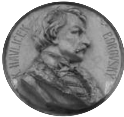
Pamětní deska na domě v Kroměříži, kde Borovský bydlel v roce 1848

Ač zdůrazňuje silně právo individua, neodmítá tím ještě autoritu církve. Je přesvědčen o tom, že ani víra bez autority neobstojí, ovšem záleží na tom, má-li ta autorita potřebnou morální váhu a nemá-li na sobě nedostatky, které svým rozumem jako nedostatky poznáváme... Chce, aby náboženství bylo odloučeno od všelijakých státních a veřejných záležitostí a touží po době, kdy se nebudou nikoho v kancelářích ptáti, jakého je vyznání... V římském náboženství ztratil se pro zlaté rámy a malované figurky člověk. Havlíček pomáhá tohoto člověka opět nalézat. Havlíčkovi patří zásluha, že náboženství ve svém vlastním pojetí dovedl popularisovat nejen svou prací, ale i svým