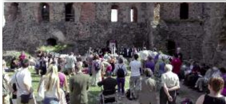
Pohled na bohoslužebné shromáždění na Krakovci