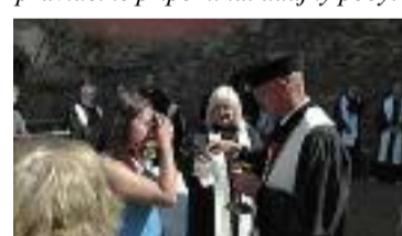
Vysluhování svátosti večere Páně na Krakovci

Letos opět 5. července odpoledne v areálu hradu Krakovec proběhla za účasti duchovních i členů církve z více než 8 vikariátů celá církev slavnostní bohoslužba - liturgie dr. K. Farského. Jde o tradici prvorepublikovou, která má pravidelně připomínat údajný pobyt M. Jana Husa na tomto hradě v létě 1414,