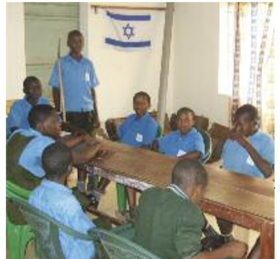
Třída v Ugandě. Uniformy a rákosky jsou standardní součástí školního vybavení.

oznámkuje. Učitel je dominantní a fyzické tresty jsou samozřejmostí. Rákoska je v každé třídě. Určitou dobu mi trvalo, než jsem děti naučila spolupracovat, tedy že mě zajímá jejich názor. Když se jich zeptám, tak chci, aby odpověděly, stejně tak aby jim bylo jasné, že chci určitou disciplínu ve třídě a nebudu k tomu používat rákosku. Až po nějaké době, při přátelském posezení, když se mě kolegové ptali na izraelské a české školy (patrně do té doby