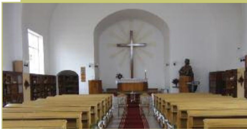
Interiér Husova sboru v Hlinsku při příležitosti svatby