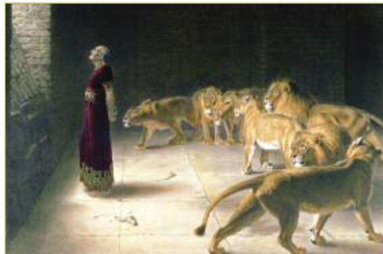
Odpověď Daniela králi Nebúkadnesarovi (Daniel v jámě lvové, kapitola 6).

Ještě jsme nestačili vstřebat událost „brexitu“ a přišel zákeřný teroristický útok ve francouzském Nice s mnoha desítkami obětí. O den později proběhl dramatický pokus o vojenský puč v Turecku, který, jak se zdá, bude mít dalekosáhlé následky v regionální i světové politice. Člověk v tom všem potřebuje slyšet biblické ujištění, že přes všechny nemoci světa, které denně vnímáme a dotýkají se nás, je tu stále přítomen