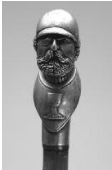
Hlávka Žižkova, dřevo, kov, zakončena kovovou hlavou Jana Žižky (Sbírka Národního muzea)

První stálá expozice Křižovatky české a československé státnosti zachycuje mezníky v dějinách naší země od roku 1918 až do zániku Československa roku 1992. Druhá expozice „Laboratoř moci“ se nachází v podzemních prostorách, kde bylo původně zázemí pro mumifikované