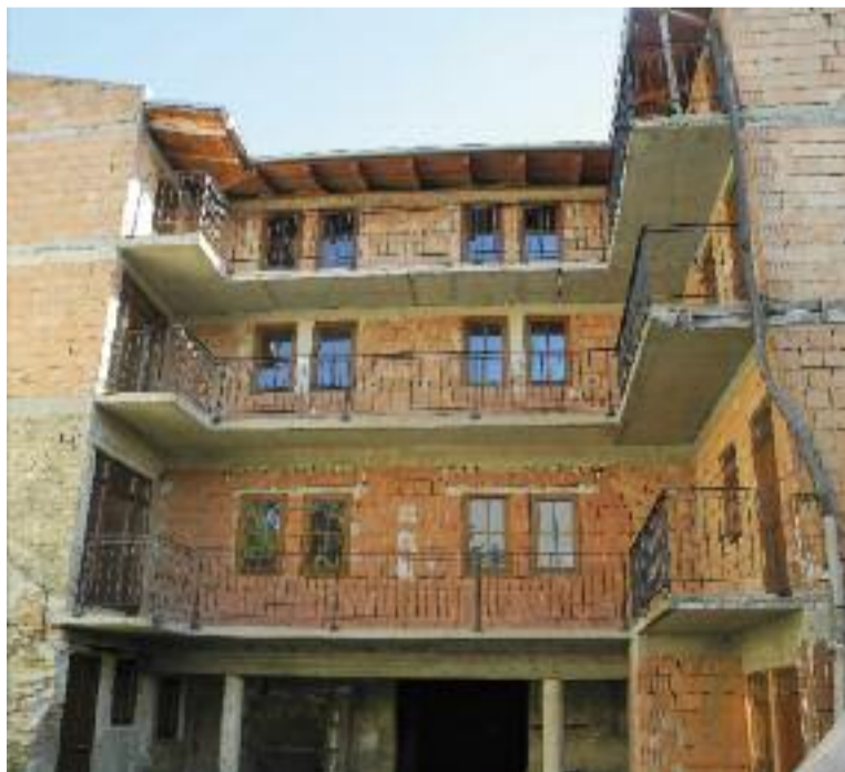
Budova rekonstruované diecézní rady s novým zábradlím na Jozefské ulici v centru Bratislavy (viz příspěvek na straně 3).