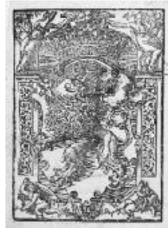
Ilustrace z předslůvků Veleslavínových knih

• Nesmíme si mysliti, že byl Veleslavín pouhý typograf. On povolání své za mnohem vyšší měl, pokládaje je co pokračování, jako za doplněk svého působení akademického, jakož toho očekávali od něho přátelé a příznivci jeho nebo jako dříve mezi čtyřmi zděmi hleděl prospívati mládeži vůkol něho shromážděné, tak nyní blahodatným, tehdy ještě velmi novým, jelikož teprv sto let před tím vynalezeným uměním kněhtlačitelským hleděl prospívati, v povolnějších mezích: vlasti, králi, Bohu.