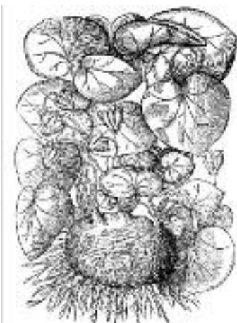
Ilustrace z Mattiolioho Herbáře