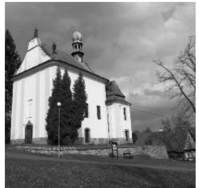
Zásada - kaple sv. Prokopa, vpravo dole stará škola

Na svátek sv. Štěpána chodili koledníci, zpravidla dva chlapci, a zpívali: „Koleda, koleda, Štěpáne, co to neseš ve džbáně, já to nesu kvasnice, budeme péct koláče. Koleda, koleda, Štěpáne, co to neseš ve džbáně, já to nesu koledu,