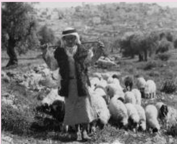
Pastýř pod Betlémem, 30. - 40. léta 20. stol.

Ježíši, jedli tu mé lásky obtížil hlad v triumfu zatajeném... Má duše poslouchá, chce dnes jen rozdávat tvým přesvatým jménem.