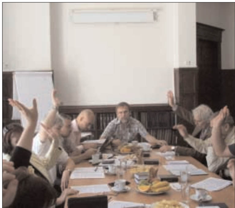
Z jednání pražské diecézní rady