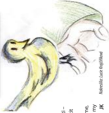
Nakreslila: Lucie Krajčířková