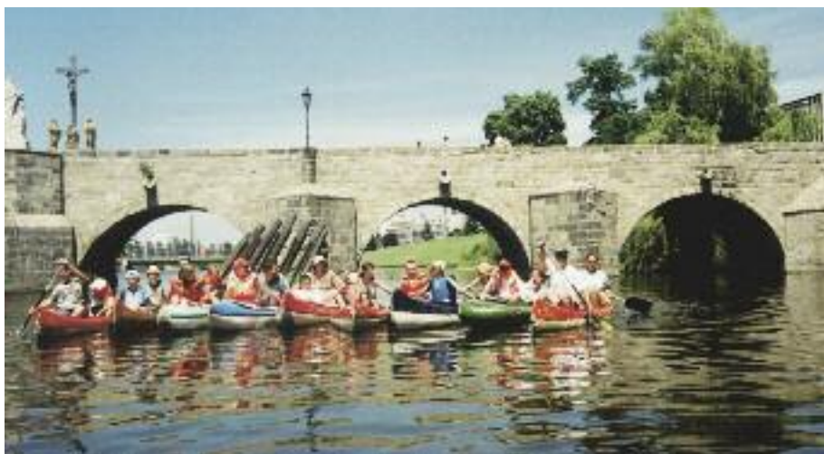
Sjíždíme Otavu. Vodácký tábor měl zpravidla jednoho vedoucího, 4-5 dobrovolníků - instruktorů a dva dobrovolníky s pojízdnou kuchyní.

Dobrovolníci Domečku přicházeli většinou spontánně na pozvání přátel. Po pár letech konání domečkovských táborů a kursů se stávali dobrovolníky i někteří odrostlí účastníci těchto akcí. Motivací dobrovolníků byla snaha být nějak užitečný a to platilo pro různé věkové kategorie. Při společném díle se setkávali