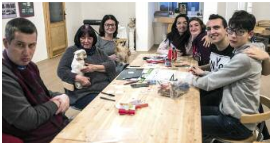
Klienti Divizny s dobrovolníky

To, že je všem dobře, že o nás ví obecni