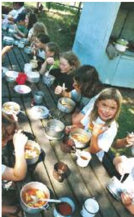
Divadelní tábor

a pak každý další rok. Vzniklo pro dospělé lidi s handicapem, aby se dostali do přírody. A protože účastníci byli především nevidomí a vozíčkáři, tak bylo nezbytné, aby ke každému byl přidělen jeden asistent. Takže poměr účastníků a dobrovolníků zde bývá vždy jedna ku jedné. Ještě více dobrovolníků a to sto procent (když nepočítáme organizačního