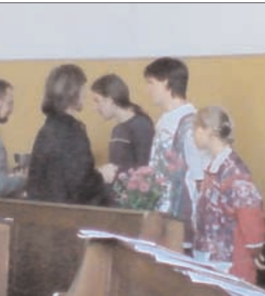
Z ekumenických bohoslužeb v České Lípě

Žijeme ve věku informací. Informačním technologiím je věnována nebyvalá pozornost a jejich vývoj předčil jakákoliv očekávání. Výsledkem internetu spustil lavinu přímo informační pohromy. Ptám se: Jsou to opravdu informace? Nebo spíše dezinformace? Slovo informace předpokládá, že se jedná o zprávu důvěryhodnou, spolehlivou a samozřejmě pravdivou. V určitém slova smyslu by se mělo jednat také o zprávu užitečnou, a právě v tom je jistý zádrhel. Stále více mi připadá většina informací spíše jako dezinformace, jako třeba Šifra Mistra Leonarda, o níž se dnes tolik diskutuje. Jistý kritik píše: „Kniha Šifra Mistra Leonarda odráží autorovy vlastní cynické názory. Autor beze všech skrupulí bere do ruky skořápky typologie, literatury, teologie, filosofie a také historie – v tomto případě nic víc než jména, data a místa – vykuchá je, vyhodí vniřnosti a zpátky do jejich prázdných