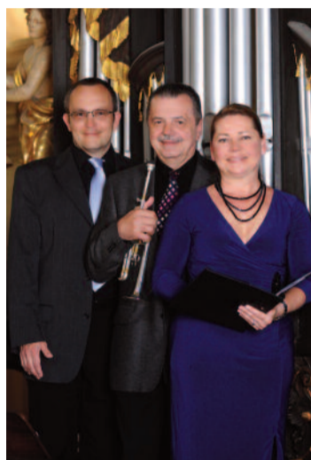
SAINT NICHOLAS CHAMBER SOLOISTS