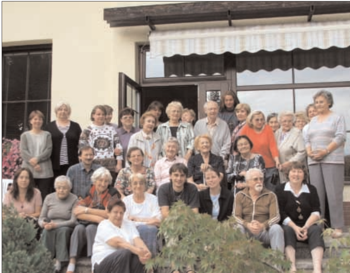
Účastníci teologické konference konané k 60. výročí kněžského svěcení žen v naší církvi