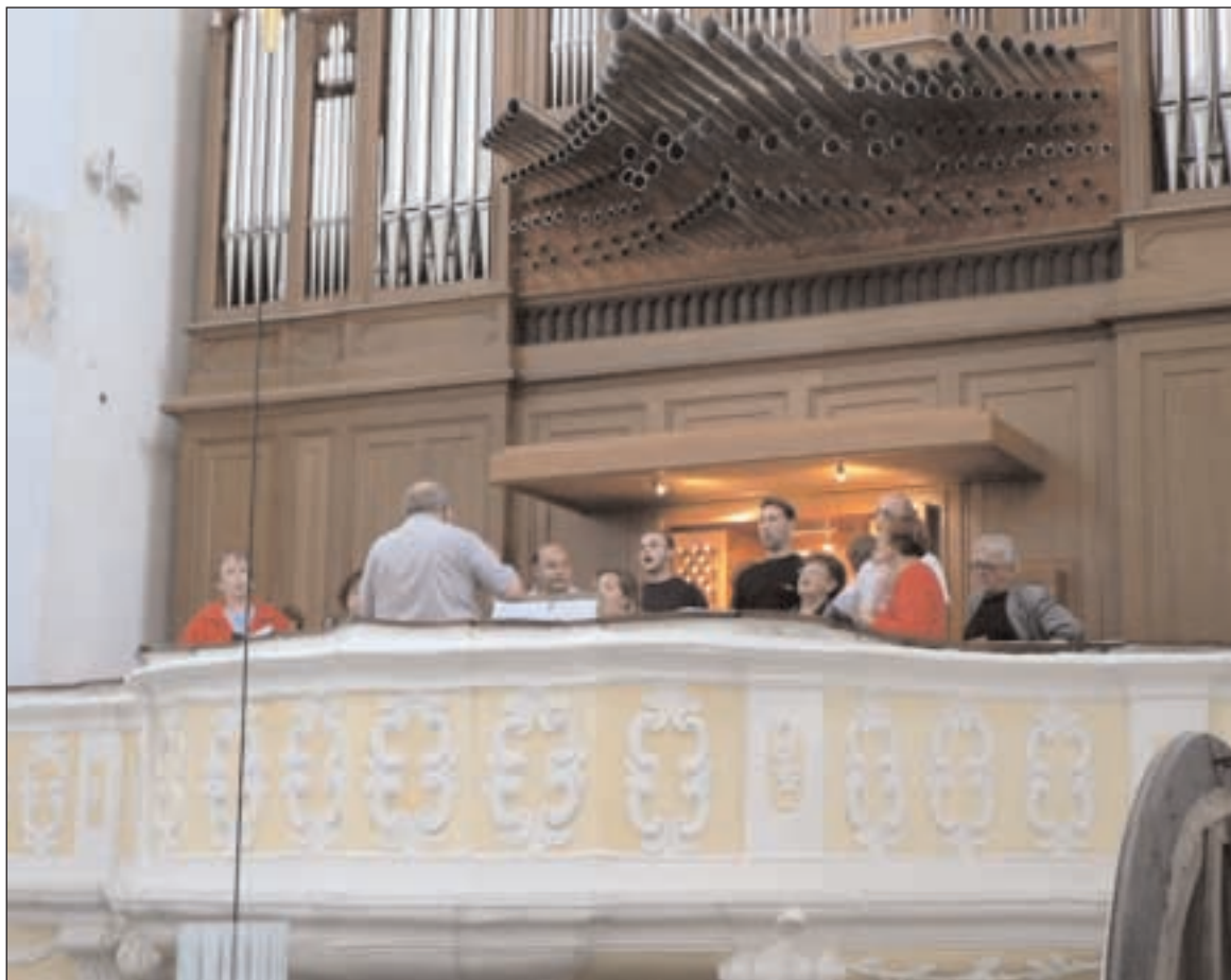
Sbor účastníků letošního varhanického kurzu na koncertě v římskokatolickém kostele Povýšení Svatého Kříže