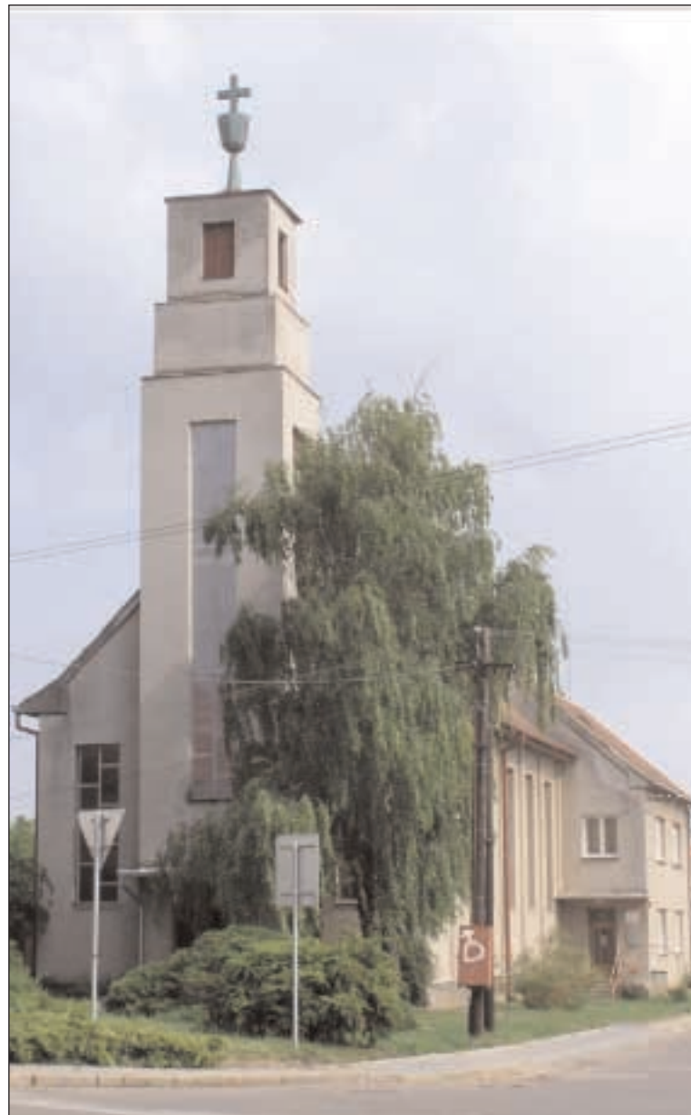
Chrám Spasitele v Hovoranech