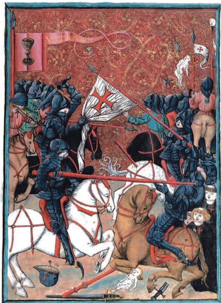
Boj husitů s křižáky. Jenský kodex

Druhý z velitelů – Jan Městecký z Opočna, byl možná ještě méně důvěryhodným člověkem. Muž, který na jedné straně podepsal 2. 9. 1415