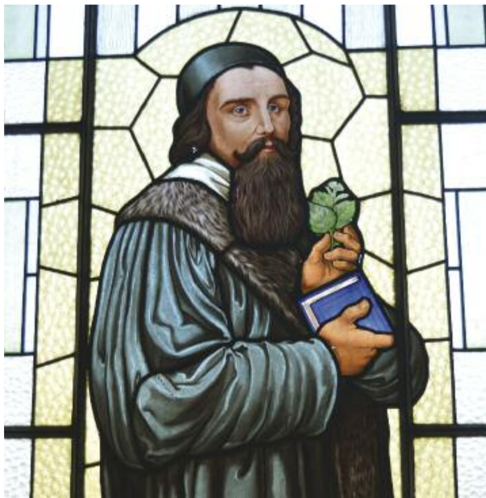
Vitráž ve sboru Církve československé husitské v Mnichovicích