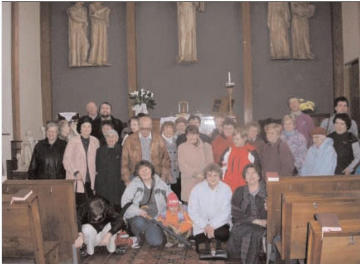
Náboženská obec Kostelní Lhota na výletě v jižních Čechách - návštěva Sboru Božích bojovníků v Táboře - viz str. 3