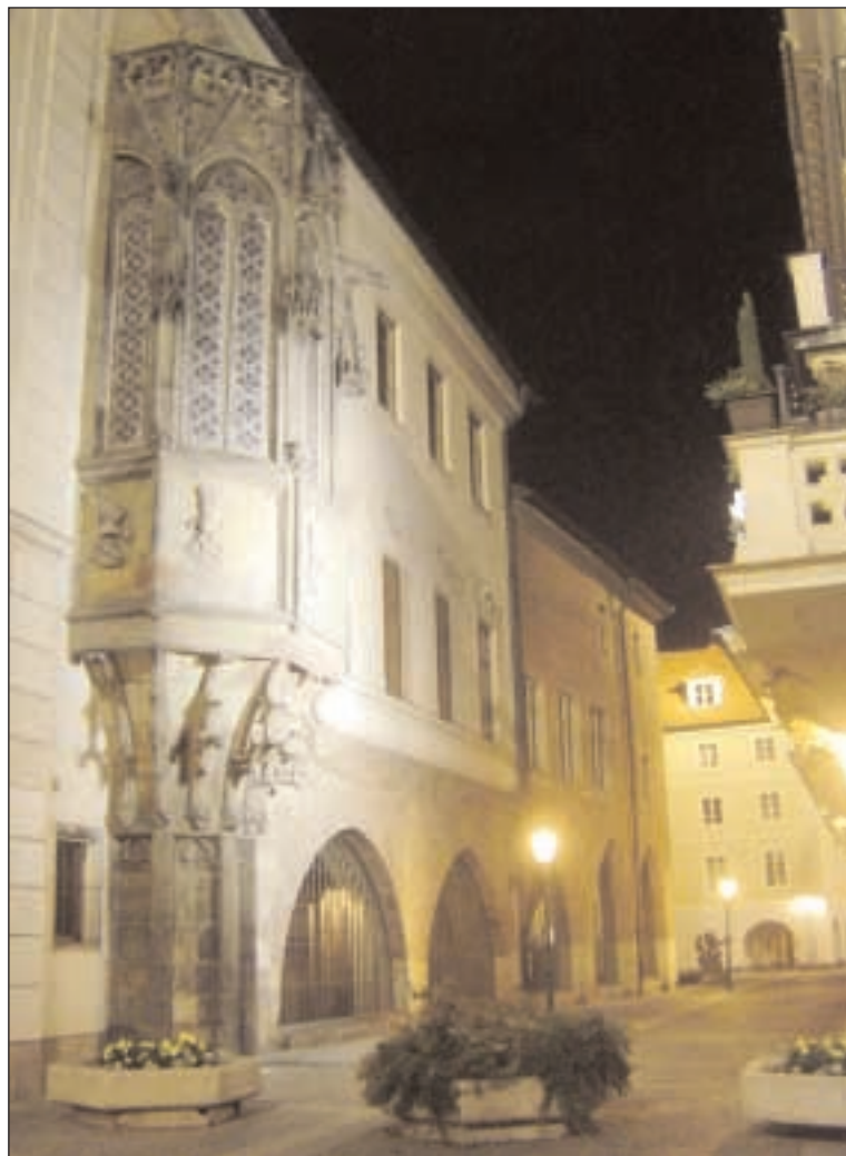
Před 625 lety daroval Václav IV. univerzitě Karolinum