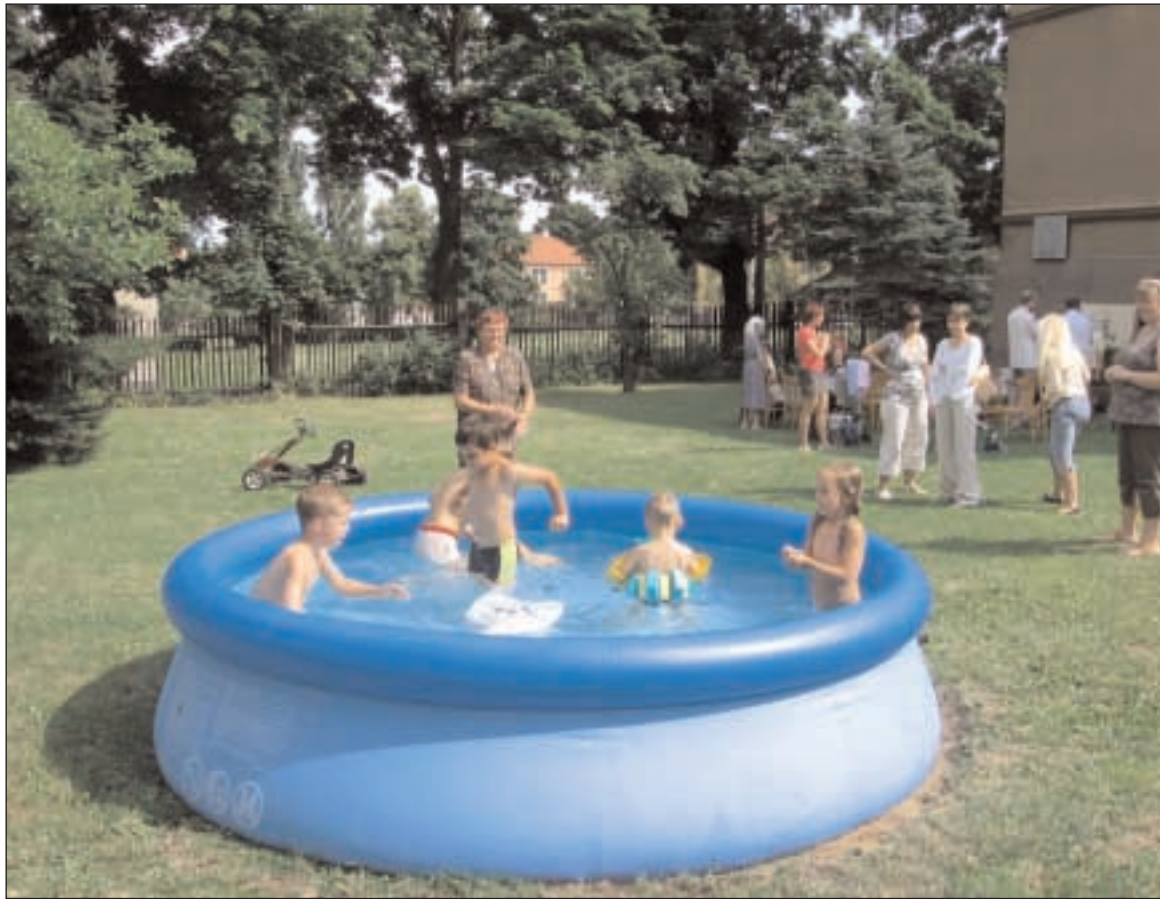
Po bohoslužbách v náboženské obci Most

Výbory naukový a legislativně-právní podle Jednacího řádu VIII. sněmu se mají kromě úkolu daného sně-