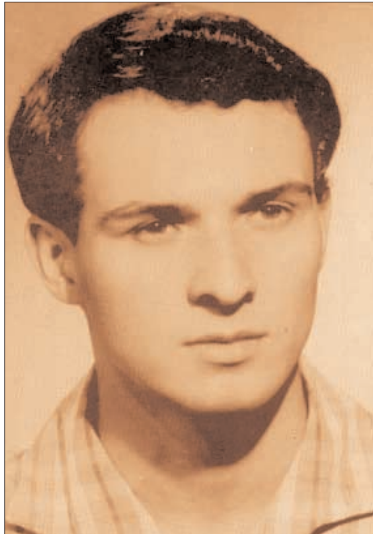
Jan Palach se upálil před 40 lety na Václavském náměstí v Praze