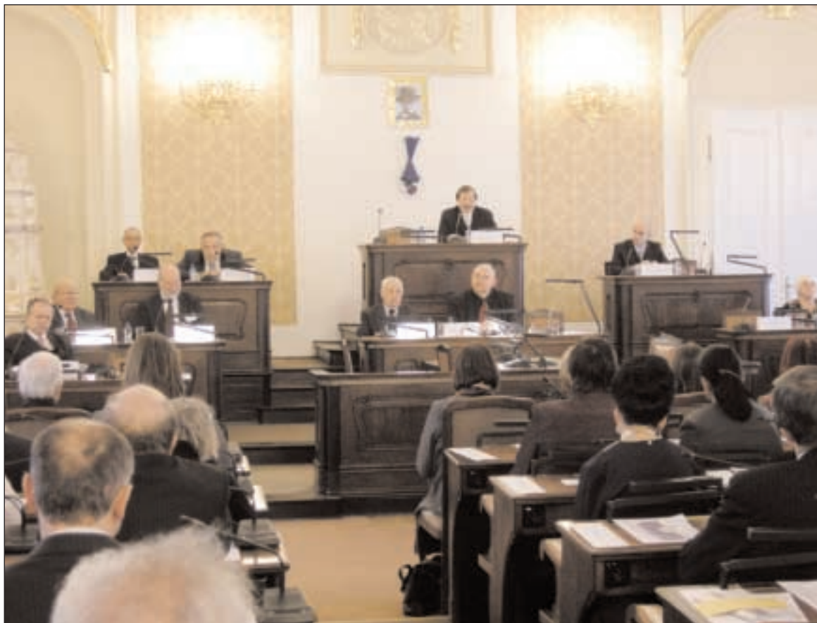
Ze setkání ke 160. výročí narození Tomáše Garrigua Masaryka v parlamentu