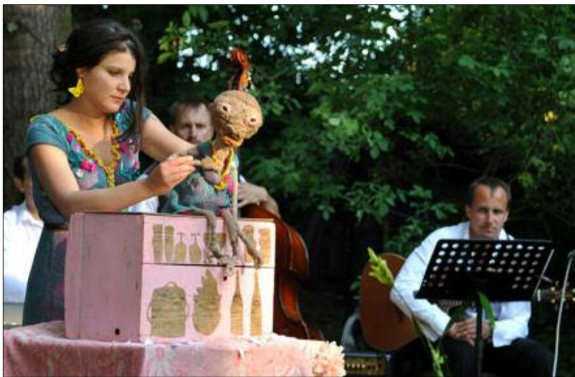
Z alternativního divadelního festivalu v Dobrušce

Nepracujete-li s internetem, jistě ve vašem blízkém okolí naleznete ně-